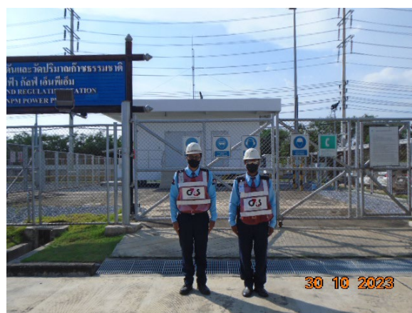
ภาพที่ 2-5 เจ้าหน้าที่รักษาความปลอดภัย บริเวณสถานี วัดและควบคุมแรงดันก๊าซ (MRS)