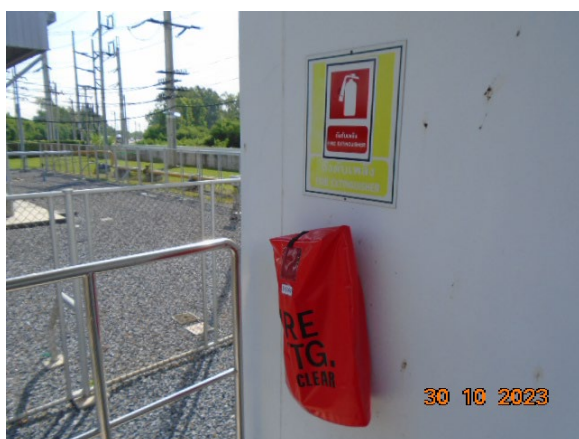
ภาพที่ 2-4 เครื่องดับเพลิงแบบเคมีผง