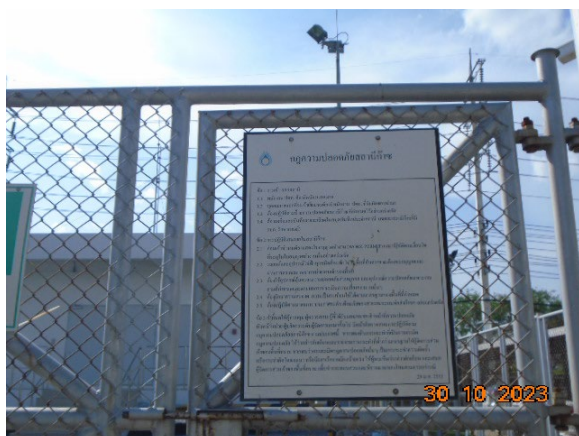
ภาพที่ 2-2 ป้ายแสดงกฎความปลอดภัยสถานีก๊าซ