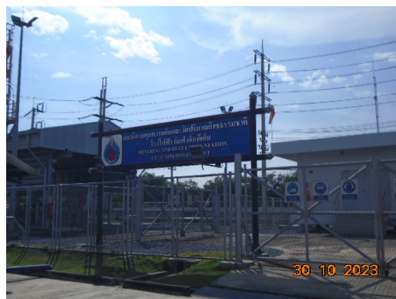
ภาพที่ 2-3 สถานีวัดและควบคุมแรงดันก๊าซ (MRS)