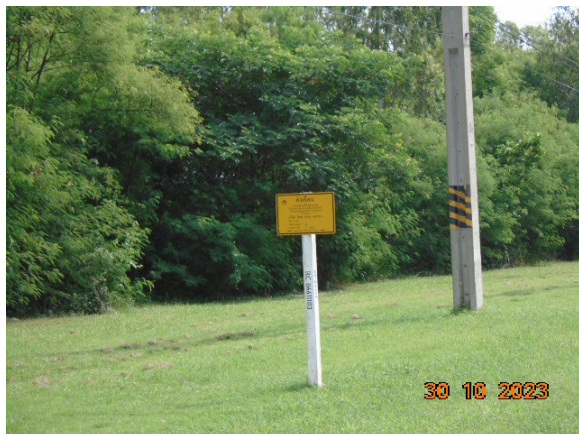
ภาพที่ 2-1 ป้ายแสดงตำแหน่งแนวท่อส่งก๊าซธรรมชาติ