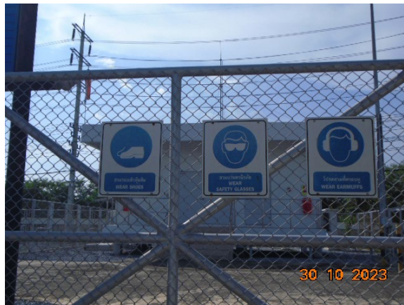
ภาพที่ 2-7 ป้ายเตือนให้สวมใส่อุปกรณ์คุ้มครองความปลอดภัยส่วนบุคคล