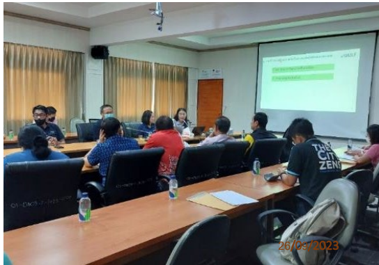
วันที่ 26 กันยายน พ.ศ. 2566