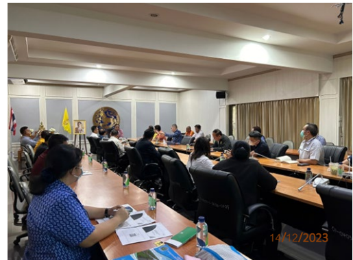
วันที่ 14 ธันวาคม พ.ศ. 2566